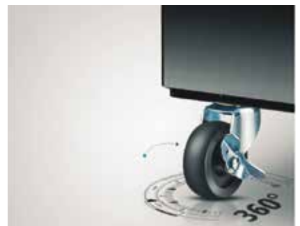
Ruedas de giro 360° con freno