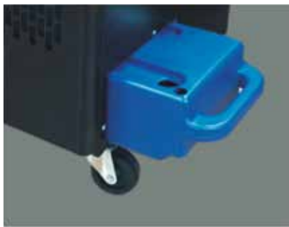
Depósito de diseño ergonómico y ajustado

La longitud máxima del conducto externo son 5 metros.