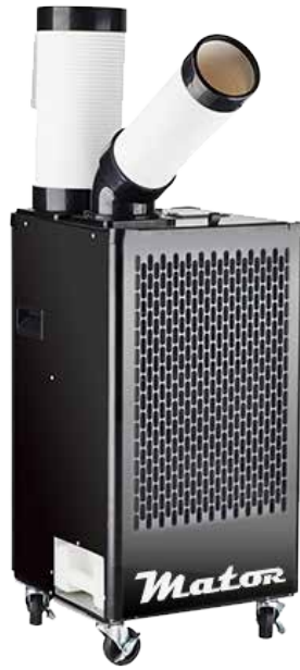
SPOT COOLER BGK- 2700