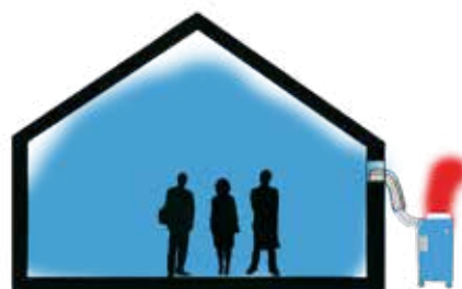
EXTERIOR Y ESTÉTICO