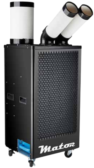
SPOT COOLER BGK- 3510