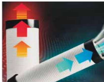
Separación de los conductos de aire caliente y frío, mejorando el efecto de aire frío