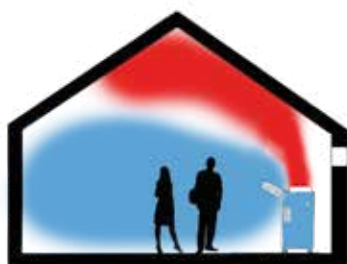
SIMPLE Y PRÁCTICO