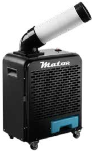
SPOT COOLER BGK- 2000